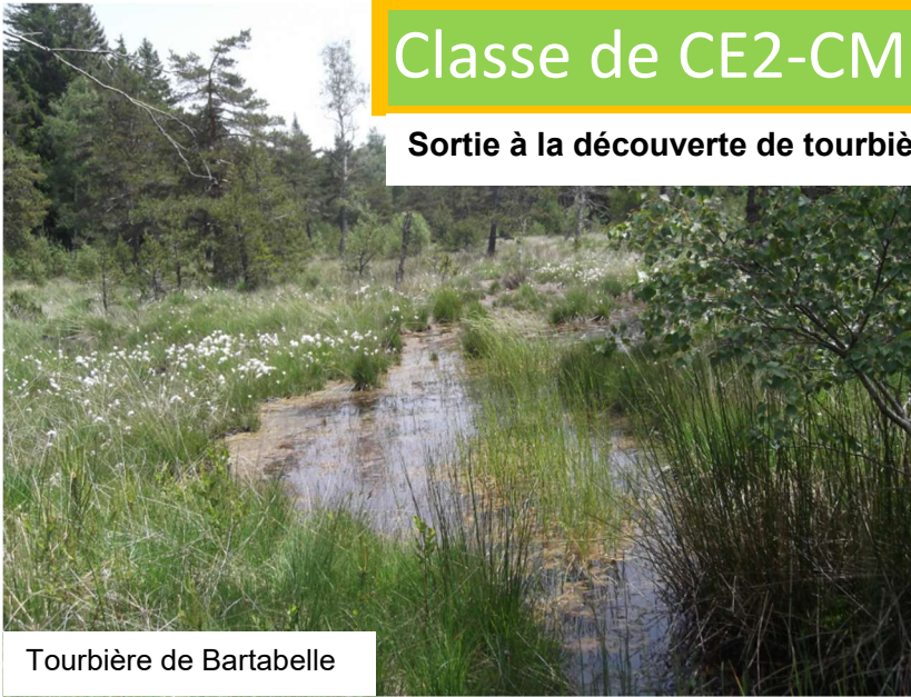
Tourbière de Bartabelle

Sortie à la découverte de tourbières sur la commune du Pont-de-Montvert