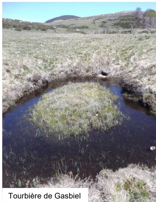
Tourbière de Gasbiel

Le garde-mondeur Benoit Deffrennes nous fait découvrir les habitants du lieu..