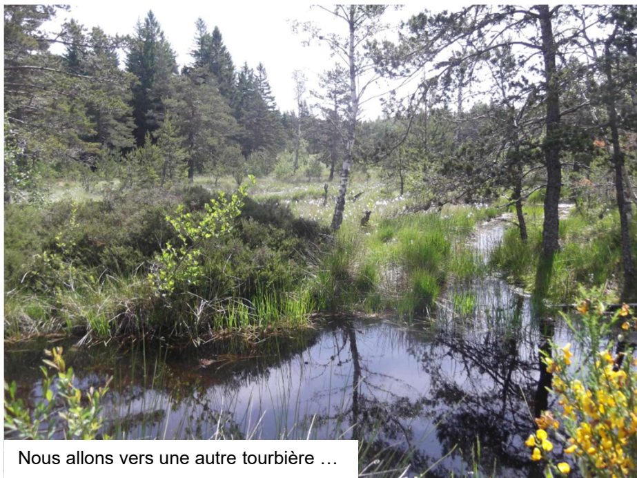
Nous allons vers une autre tourbière ...