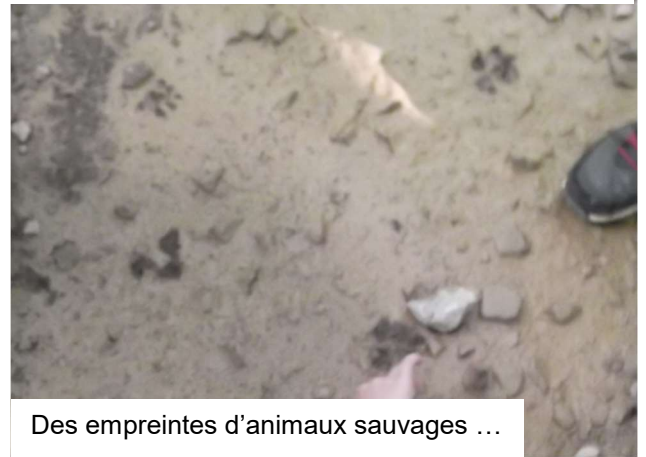
Des empreintes d'animaux sauvages ...