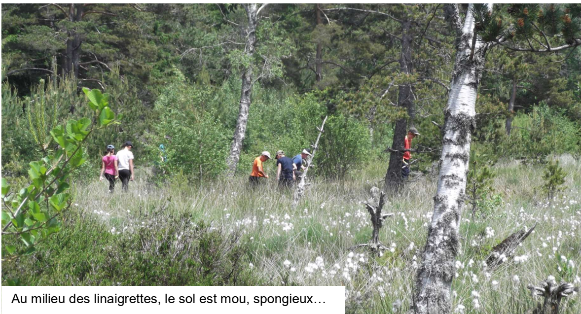
Au milieu des linaigrettes, le sol est mou, spongieux...