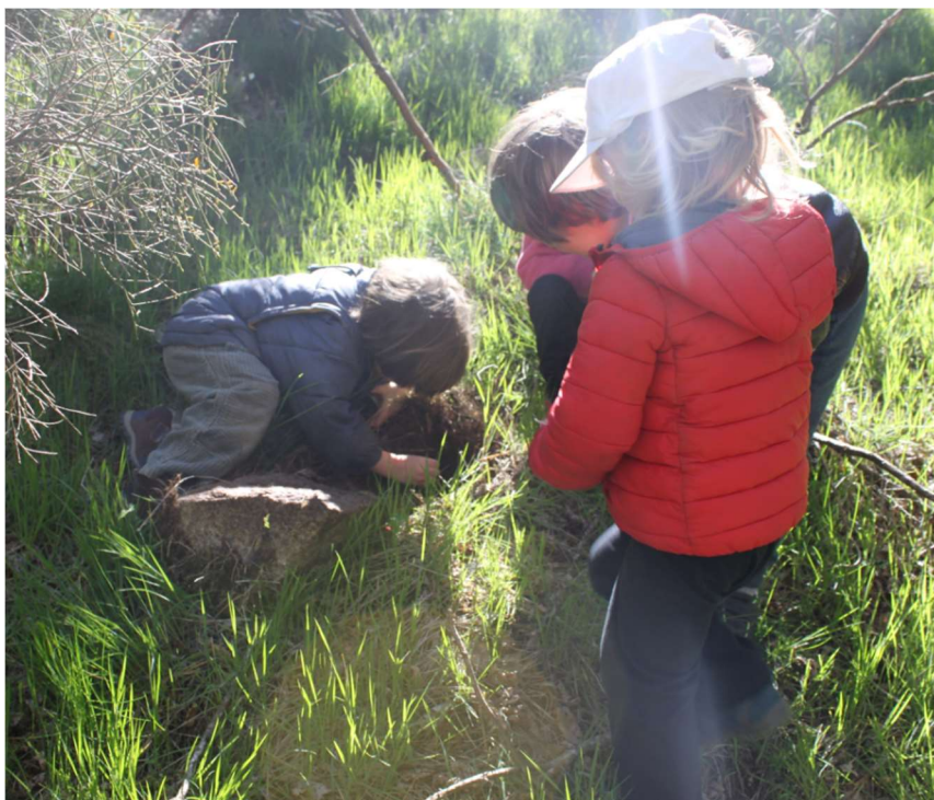
Recherche avec des boîtes-loupes