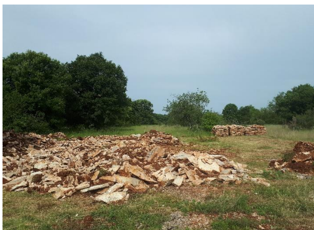
Le site d'extraction de lauze calcaire à Grèzes