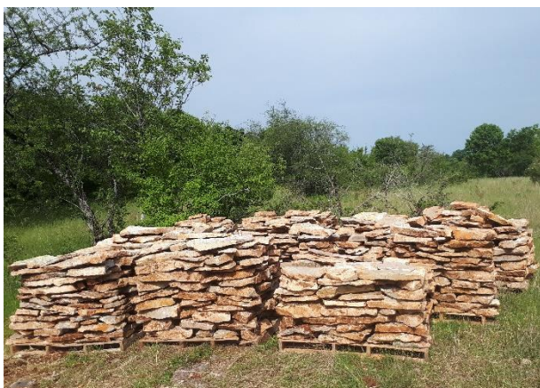
Palettes de lauzes brutes stockées après extraction sur le site de Grèzes