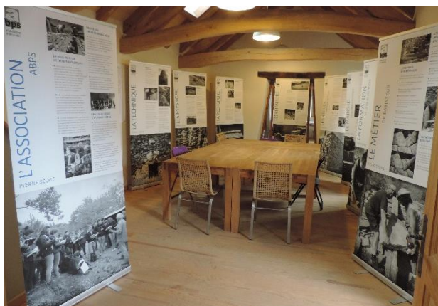
L'exposition itinérante « Du savoir-faire à la filière pierre sèche » dans les bureaux ABPS à l'Espinas

Cette exposition servira de support de communication dans les salons et les manifestations du Massif central, par exemple dans les locaux des PNR partenaires de l'action LAUBAMAC (Grands Causses, Causses du Quercy et Monts d'Ardèche). Elle a déjà été montrée lors de visites à l'Ecole professionnelle de la pierre sèche (étudiants de l'ENSAM par exemple), aux Journées Nationales de la Maçonnerie (JNM) à Marne-la-Vallée et