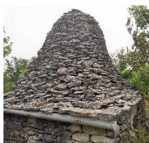
Le toit de la caselle en lauze calcaire

Par ailleurs, le chantier de restauration d'un toit de cazelle a également été identifié à proximité du site d'extraction, près de Marcihac-sur-Célé (46160).