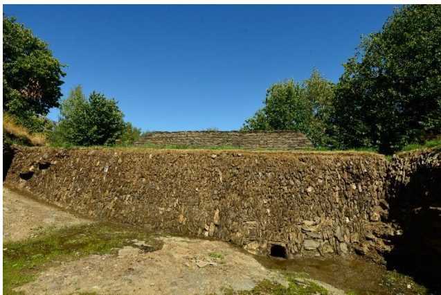
Mur clavé d'une gourgue, Moulin Bonijol de Figeirolles, Lozère

poursuivre l'inventaire déjà bien avancé sur la typologie et le recensement des ouvrages en pierre sèche clavée en Ardèche, en Lozère et en Aveyron. Il a pu déterminer les caractéristiques et les principaux usages de ce type d'ouvrage spécifique. Après avoir réfléchi aux différentes applications de la pierre debout contemporaine (gabions, encochements...), le Parc cherche actuellement un chantier public pilote pour se positionner sur un ouvrage clavé de soutènement routier ou d'une passe à