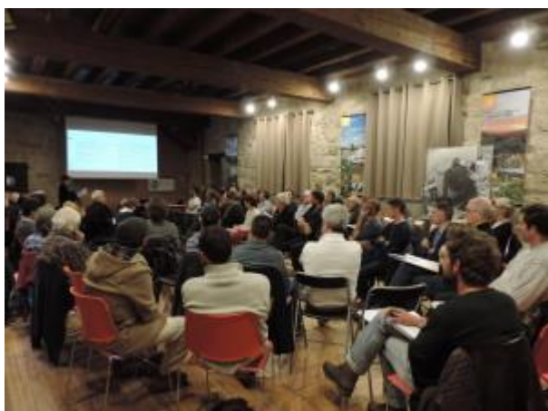
Rendu officiel de l'étude de marché des filières lauze et pierre sèche au PNC

Le Parc national des Cévennes a mis en place une étude de marché pour effectuer une analyse des filières de la lauze et de la pierre sèche à l'échelle du Massif central. Lancée en juillet 2017 et réalisée par le groupement MIDI-MARKETING et Espitalié Consultants, l'étude finale a été présentée le 9 avril 2018 au siège du PNC à Florac en Lozère.