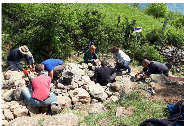
Formation atelier calade, Rocher de Brions, Jaujac Accons, Ardèche, ELIPS, mai 2018

Par ailleurs, des journées de démonstration ont été mises en place en 2018 afin de promouvoir la technique de construction de la calade pour des aménagements contemporains. Plusieurs chantiers se sont déroulés sur le territoire des monts d'Ardèche, il s'agit de formations de sensibilisation à destination du tout public et d'employés communaux, avec le CNFPT (Centre National de la Fonction Publique Territoriale). Deux structures réalisent ces actions : l'association ELIPS, (4 actions), et l'entreprise De Pierre et de Bois (1 action).