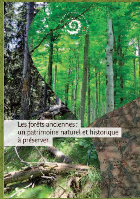
Les forêts anciennes : un patrimoine naturel et historique à préserver

© Conception & impression Parc national des Cévennes • Ne pas jeter sur la voie publique