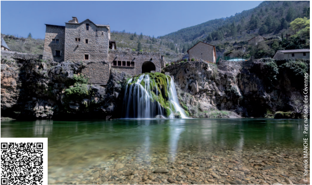
© Yannick MANCHE - Parc national des Cévennes