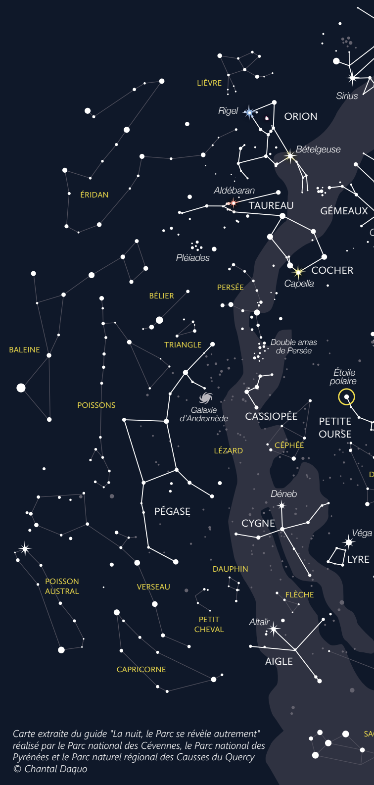
Carte extraite du guide "La nuit, le Parc se révèle autrement" réalisé par le Parc national des Cévennes, le Parc national des Pyrénées et le Parc naturel régional des Causses du Quercy © Chantal Daquo