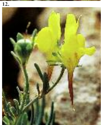
Foto oben : 8. Drosera (J.-P. Malafosse) 9. Cephalanthera rubra (Y. Maccagno) 10. Lilium martagon (Y. Maccagno) 11. Pulsatilla vulgaris (Y. Maccagno) 12. Linaria supina (Y. Maccagno)