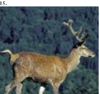
13. Geier (A. Aigouin) 14. Otter (J.-P. Malafosse) 15. Hirsch (Zehnder) 16. Tengmalm Eule (J.-F. Noblet) 17. Biber (J.-M. Petit)