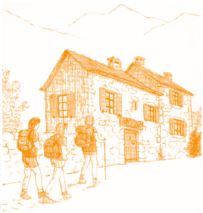
Brique et impression Parc national des Cévennes Janvier 2011.

Les hébergements pour randonneurs dans l'aire optimale d'adhésion du Parc national des Cévennes