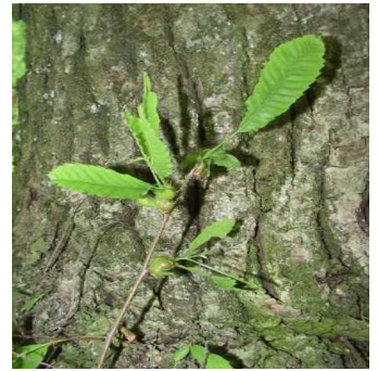
Galles sur jeune rameau

de plusieurs dizaines d'hectares se situe autour de Valence. Au vu des symptômes, ce foyer est actif depuis plusieurs années.