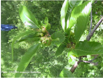
Galles sur bourgeons