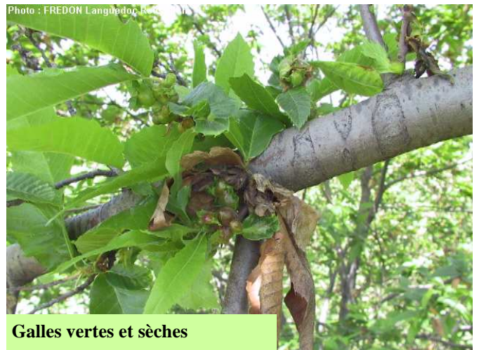
Galles vertes et sèches