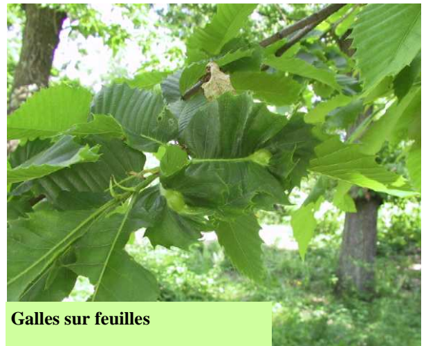
Galles sur feuilles

Pas de symptôme visible en hiver en début d'attaque