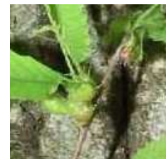
Détail d'une galle

3/ Contact er votre service technique ou le Service Régional de l'Alimentation de votre région afin que des échantillons soient prélevés en vue d'analyse officielle (voir Contacts ci-dessous).