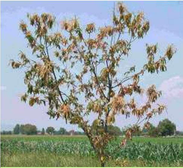
Arbre contaminé Photo 1

Informez vous auprès des personnes ressources Retrouver les infos en ligne sur les sites de la DRAAF et de la CRALR (BSV Arboriculture et ZNA)