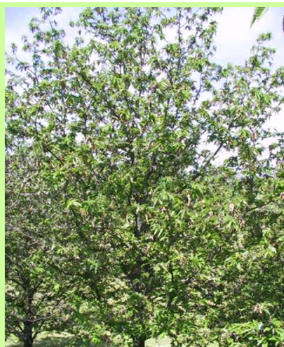
Châtaignier infesté depuis plusieurs années

A noter que les galles restent fixées sur l'arbre pendant plusieurs mois : il est alors possible d'observer sur les arbres atteints des galles sèches ainsi que des feuilles et des rameaux secs au cours de l'été et jusqu'au printemps suivant.