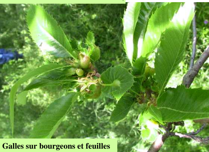
Galles sur bourgeons et feuilles