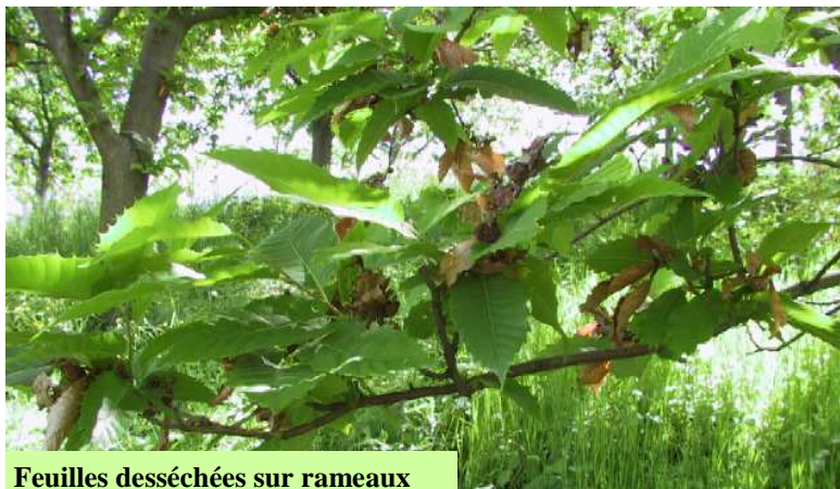
Feuilles desséchées sur rameaux