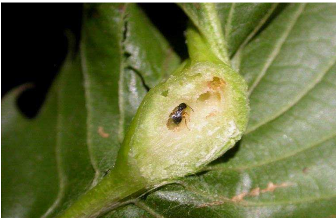
Photo 2 : galle en coupe : Fabio Stergule, Università di Udine, Bug- 5383036

Informez vous auprès des personnes ressources Retrouver les infos en ligne sur les sites de la DRAAF et de la CRALR (BSV Arboriculture et ZNA)